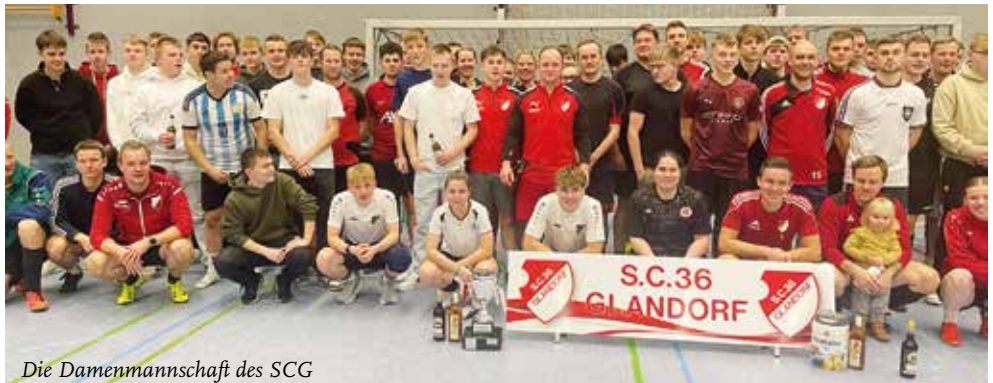
Die Damenmannschaft des SCG

Im nächsten Jahr soll das Turnier wieder am ersten Wochenende im Januar stattfinden. Schon jetzt freuen wir uns sehr darauf und hoffen wieder auf eine rege Teilnahme aller Teams, damit es so spannend wird wie in diesem Jahr!