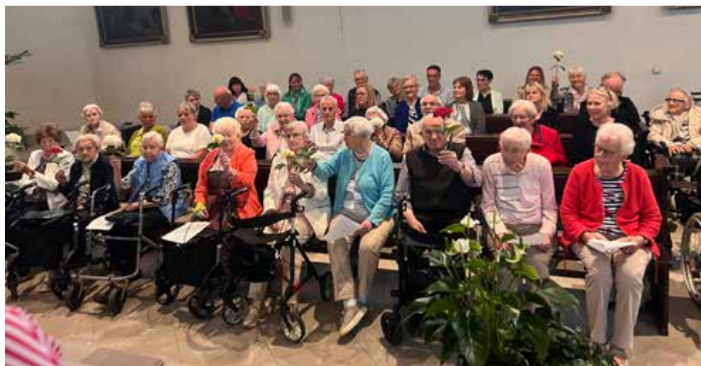
Start des Sommerfests mit Wortgottesdienst in der Kirche St. Johannis.