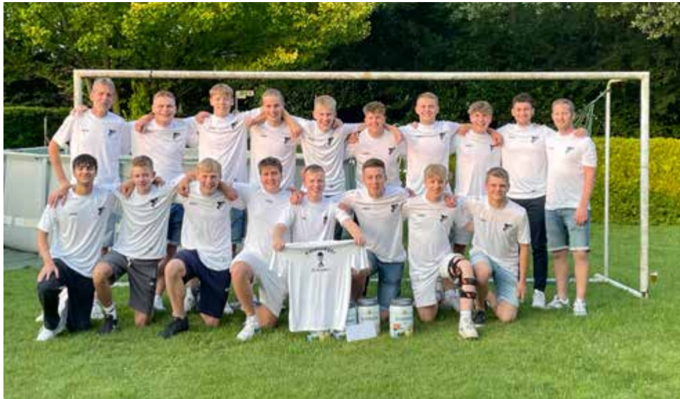
Die Pokalsieger – Danke an den „Förderverein Fußball“ für die großzügige Spende der Pokalshirts