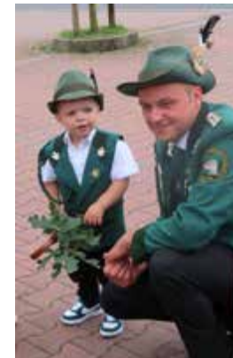
Auch die Kleinsten sind mit dabei!